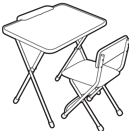
(рис. 1) Комплект мебели, арт. Д1П/Т

Перед эксплуатацией следует ознакомиться с паспортом и руководством по эксплуатации. Следуя инструкции, выполните установку стола и стула.