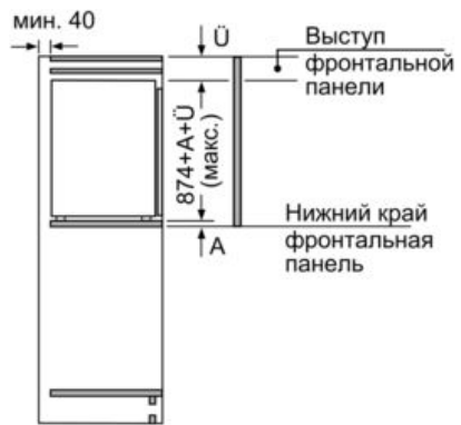
Размеры в мм