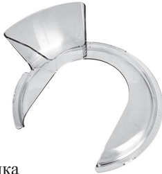
Крышка с воронкой