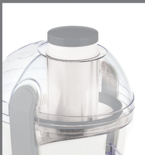
Легкая сборка и обслуживание, прозрачный корпус