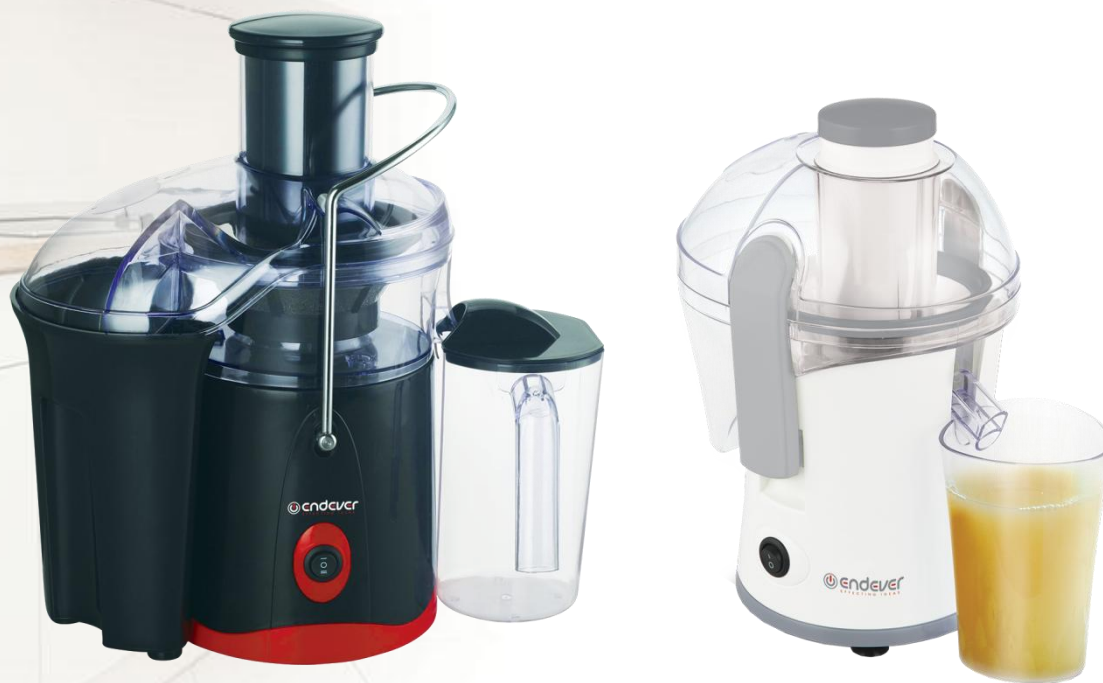
ENDEVER Sigma 99/ Sigma 96