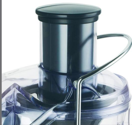
Экстра-широкое отверстие для фруктов-75 мм