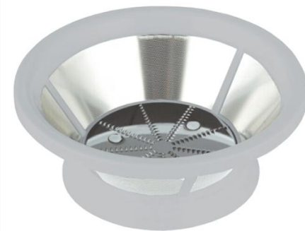
Нержавеющий стальной фильтр обеспечит надежное и долговечное использование