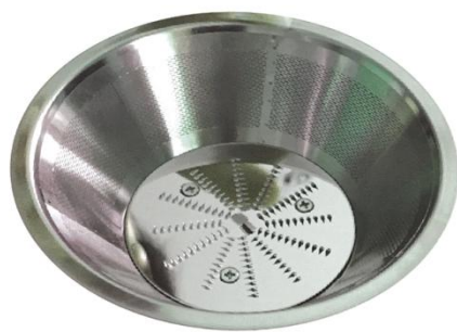
Сито из нержавеющей стали