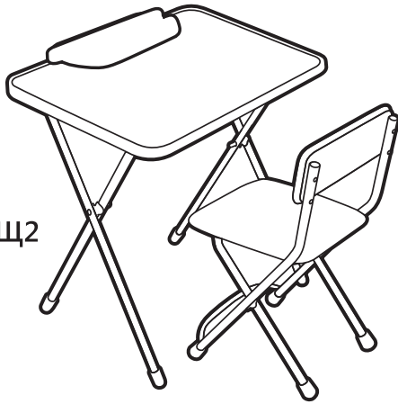
(рис. 1) арт. Щ2