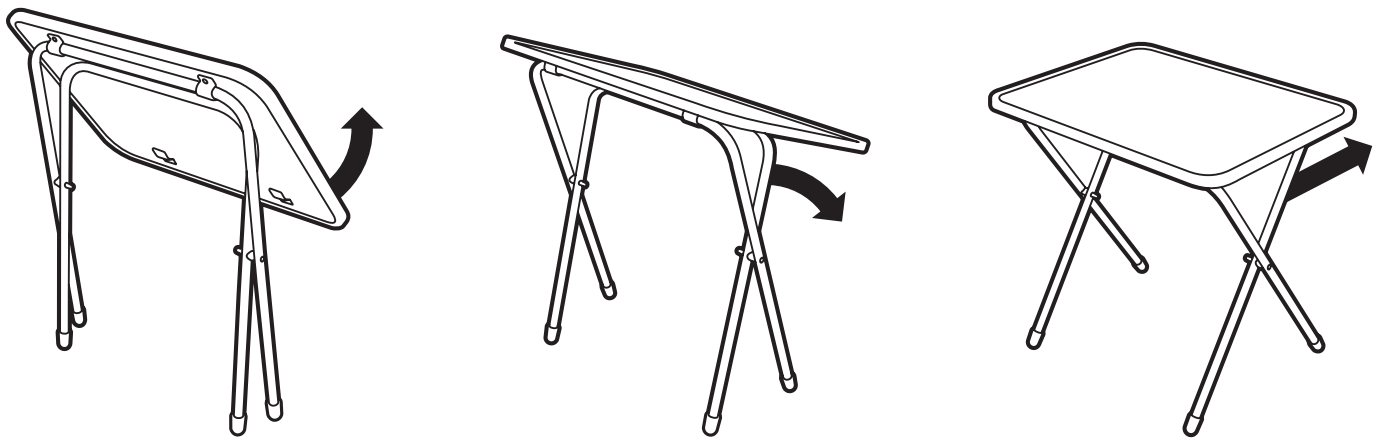
(рис. 3) Схема раскладывания стола