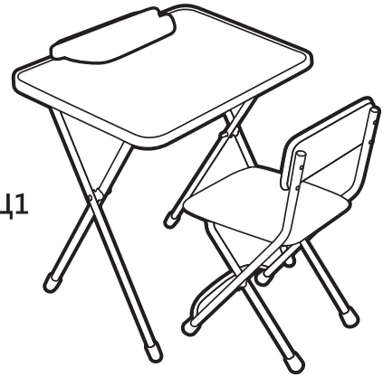
(рис. 2) арт. Щ1

Перед эксплуатацией следует ознакомиться с паспортом и руководством по эксплуатации. Следуя инструкции, выполните установку стола и стула.