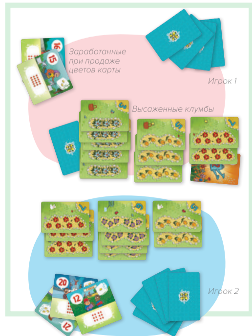
Рис. 2. Пример расположения карт во время игры.

В этой стадии можно выполнить любые из описанных ниже четырёх действий в любом порядке. Действия можно повторять несколько раз за ход или не выполнять вовсе. Например, можно выкорчевать клумбу, посадить на это место цветы, продать их и снова посадить цветы на освободившееся место.