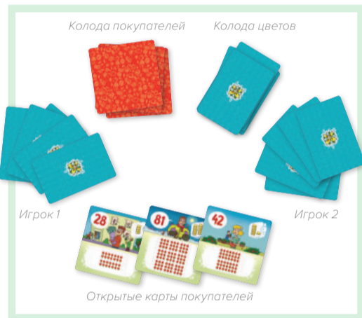
Рис. 1. Первоначальная раскладка.

Игроки ходят по очереди, по часовой стрелке. Первым ходит самый младший.