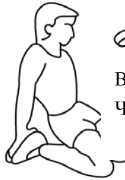
ВНЕШНЯЯ ЧАСТЬ БЕДРА