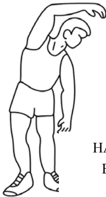
НАКЛОНЫ В СТОРОНЫ

Этот этап поможет улучшить кровообращение и настроить мышцы на дальнейшую работу. Это сокращает риск судороги и травм. Рекомендуется выполнять несколько разминочных упражнений, показанных ниже. Каждое упражнение следует выполнять в течение 30 секунд, не перенапрягайте и не рвите мышцы во время растяжки – если вам больно, ОСТАНОВИТЕСЬ .