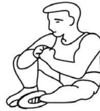
ВНУТРЕННЯЯ ЧАСТЬ БЕДРА