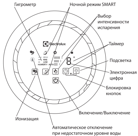
Рис. 3. Дисплей и панель управления