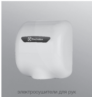
электросушители для рук