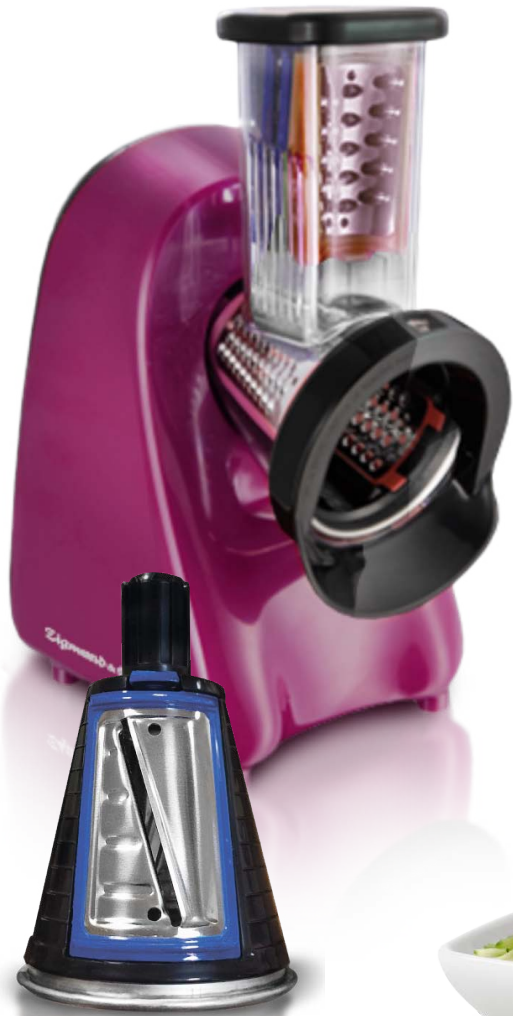
Каркас для насадок