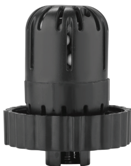
Рис. 7 Фильтр-картридж FC-1000

В комплект прибора входит фильтр с ионообменной смолой. При длительном использовании увлажнителя без замены фильтра на приборе и на предметах рядом с ним может появиться белый осадок.