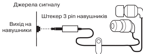
Мал. 1. Схема підключення