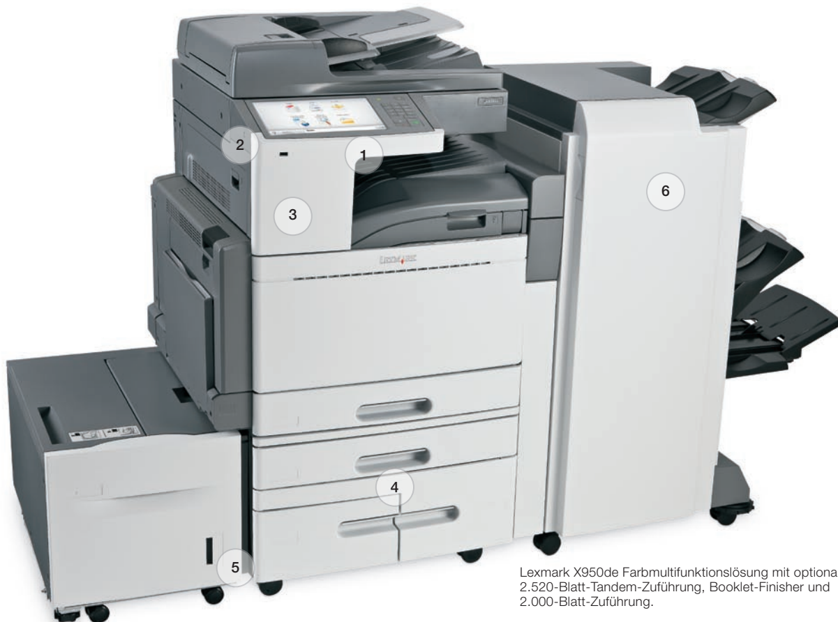
Lexmark X950de Farbmultifunktionslösung mit optionaler 2.520-Blatt-Tandem-Zuführung, Booklet-Finisher und 2.000-Blatt-Zuführung.