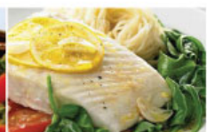
Варка на пару