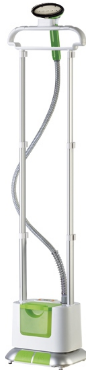
Отпариватель MIE ASSISTENTE с ножным управлением