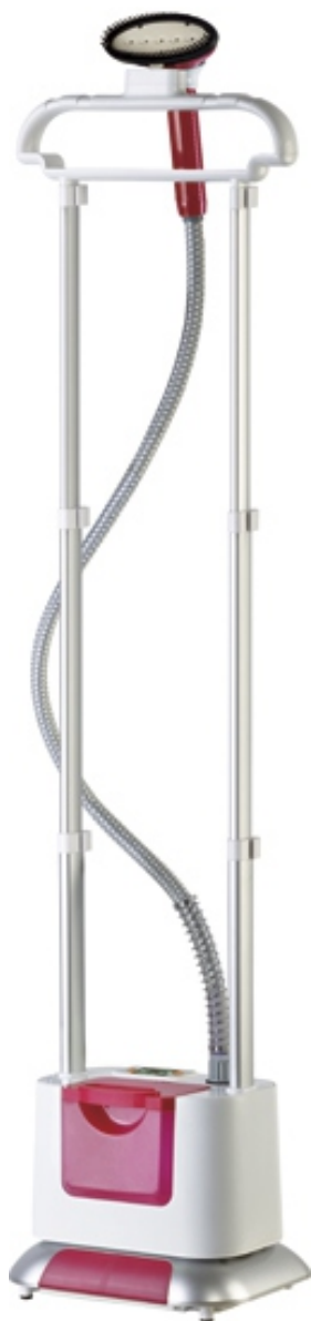
Отпариватель MIE ASSISTENTE с электронным управлением