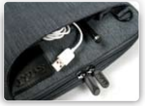
Zipped Front and Back Pockets for accessories Poches zippées avant et arrière pour accessoires