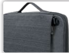
Discrete and thin handle on the side of the Case Poignée fine et discrète sur le flanc du sac

Designed for tablets up to 10.1" Developper pour tablettes jusqu'au format 10.1"