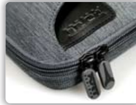
Flexible Rubber pullers Tirette en gomme souple