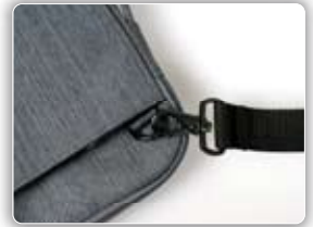
Black Metal buckles Bouclerie métallique noire