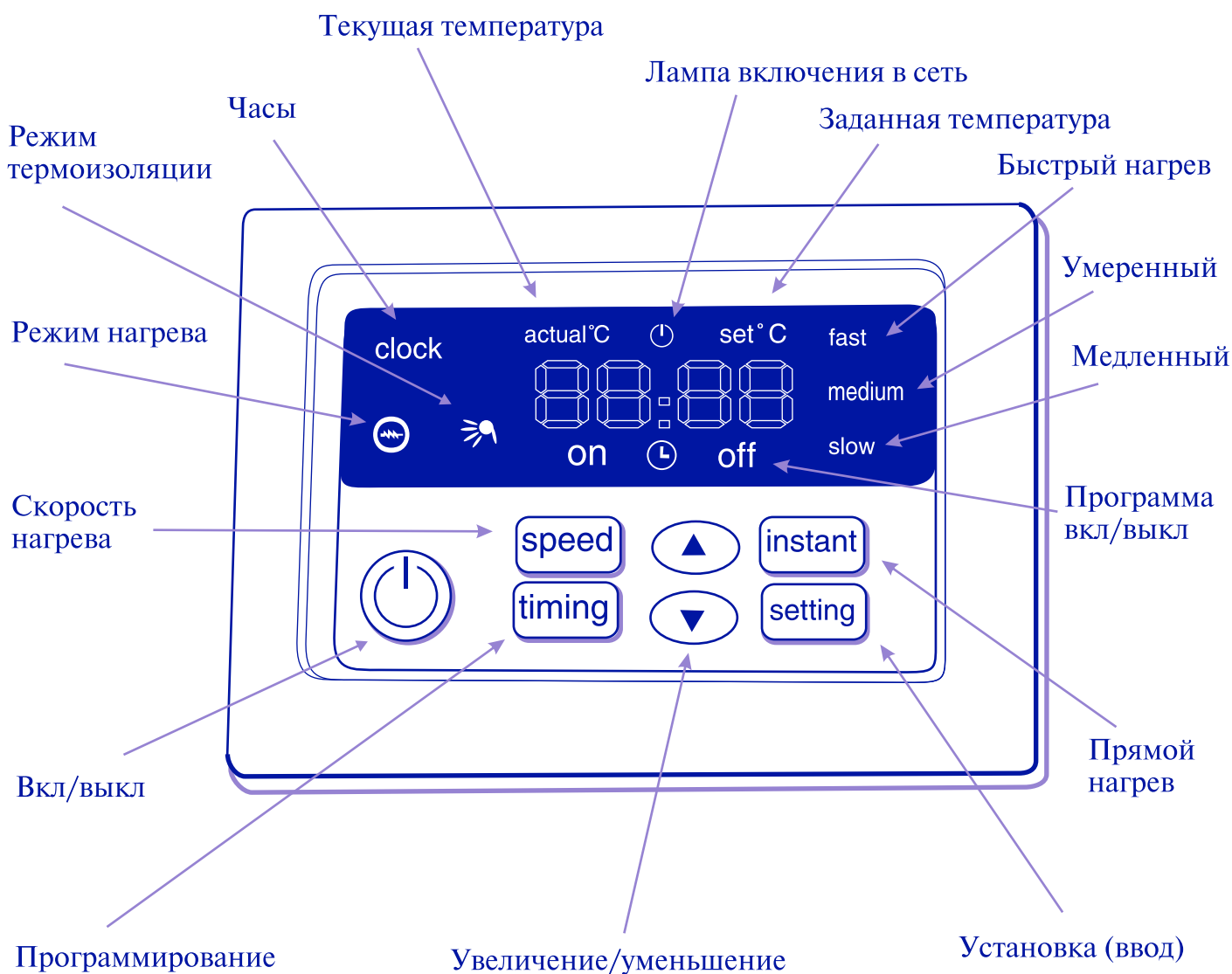
Рис.1. Расположение функциональных кнопок блока управления.

7.4.11. В режиме работы ЭВН по программе экран дисплея попеременно высвечивает значения текущей и заданной температуры, а также текущего и заданного времени включения/выключения с интервалом в 5 секунд.