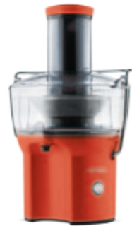
S403 — красная