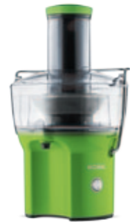
S401 — зеленая