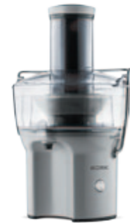
S400 — серебристая