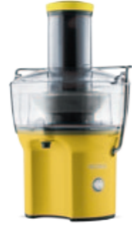
S402 — желтая