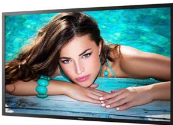
Full HD Resolution