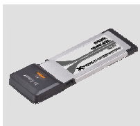
DWA-643 Xtreme N ™ Notebook ExpressCard ™

Если что-либо из содержимого отсутствует, пожалуйста, обратитесь к поставщику.