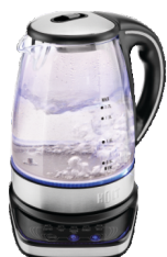
Чайник HOLT HT-KT-017