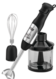
Блендер HOLT HT-BL-008