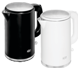
Чайник HOLT HT-KT-020 белый, черный