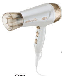
Фен HOLT HT-HD-006