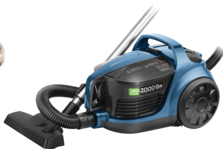
Пылесос HOLT HT-VC-009