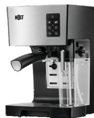
Кофеварка HOLT HT-CM-006