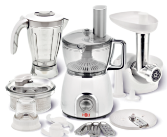
Кухонный комбайн HOLT HT-FP-004