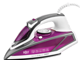
Утюг HOLT HT-IR-013