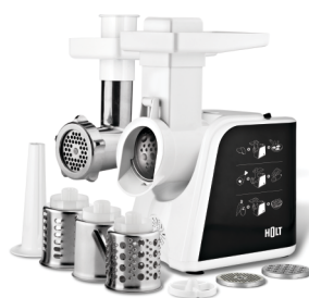
Кухонный комбайн HOLT HT-FP-003