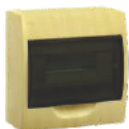
Серия ЩРН-П в эко-стиле