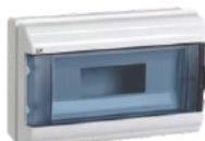
Серия КМПн IP55