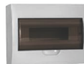
Серия ЩРН(В)-П LIGHT