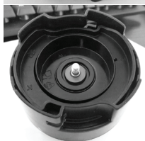
2. Сзади наденьте коричневую прокладку