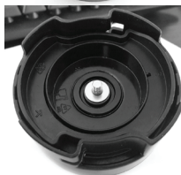
3. Наденьте металлическую белую прокладку