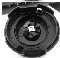
5. Вставьте в шестеренку фиксирующую гайку и закручивайте против часовой стрелке