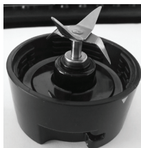
1. Вставьте ножи в отверстие

Примечание. Если фиксирующую гайку не закрутить, как следует, то в процессе работы она может раскрутиться. Это происходит, когда гайка недостаточно сильно фиксирует ножи в ножевом блоке, и смесь в чаше достаточно вязкая. После процесса работы блендера смесь еще продолжает вращаться и, вместе с тем, вращать ножи, которые начинают раскручиваться. Поэтому закручивайте гайку при сборке достаточно сильно, что бы ножи в процессе работы не открутились.