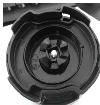
4. Наденьте шестеренку