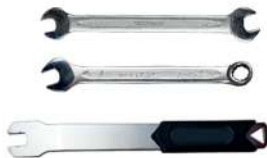
5. Ключ (8, 9, 10, 15)