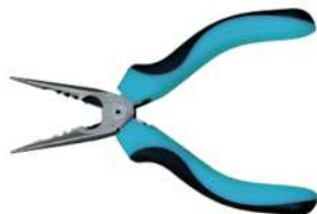
2. Плоскогубцы, для обжима троса